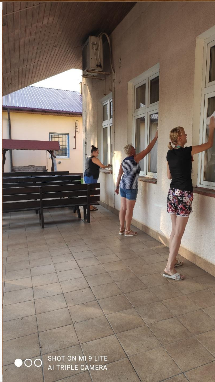
SHOT ON MI 9 LITE AI TRIPLE CAMERA