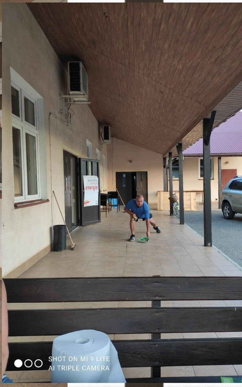
SHOT ON MI 9 LITE AI TRIPLE CAMERA