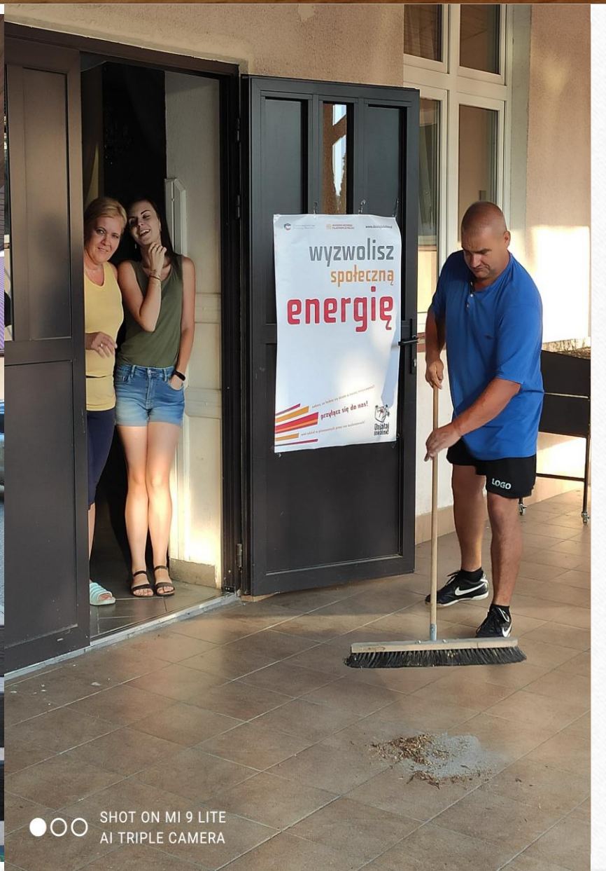
SHOT ON MI 9 LITE AI TRIPLE CAMERA